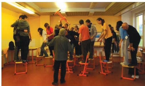
Osoby jsou na židlích jsou o něco vyšší

Tak jsem se stala svědkem workshopu nazvaného Židle - kreativní a akční hry. Úkolem je namalovat židli, na které by se dalo sedět a následně takovou, na které se sedět nedá.